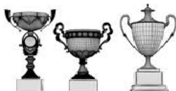
Las copas, a la entrada del Liceo